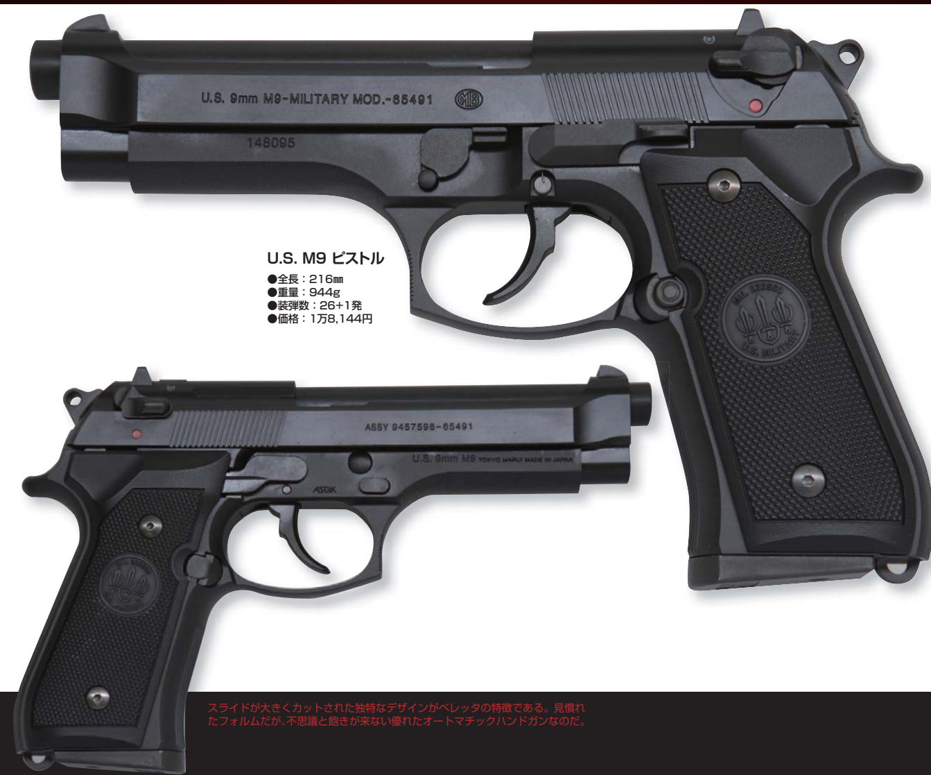
U.S. M9 ピistol