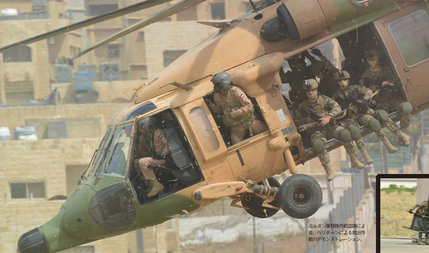
ヨルダン軍特殊作戦部隊による、ヘリボーンによる救出作戦のデモンストレーション。