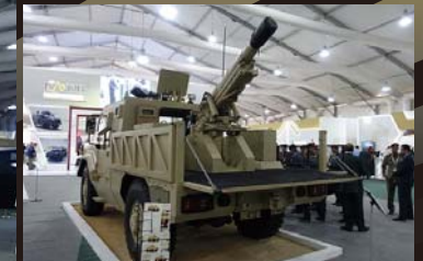
後部がフラットになったウエポンキャリアー型で、105mm砲を搭載した自走砲タイプ。105mm砲の最大射程は10.4kmである。