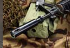
XM177E2独特のロング・サブレッサー。アルミを素材に、丁寧に仕上げられたパーツだ。