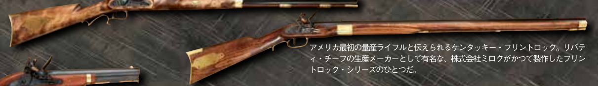
アメリカ最初の量産ライフルと伝えられるケンタッキー・フリントロック。リパティ・チーフの生産メーカーとして有名な、株式会社ミロクがかつて製作したフリントロック・シリーズのひとつだ。

独立戦争後に、アメリカ政府が製作した将校用のハーバースフェリー・ピストル。独特のデザインは、撃った後重心部分を握って、銃器として使用するためだったとも伝えられている。