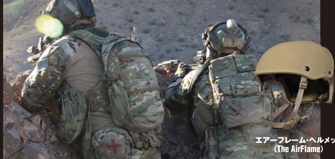
エアフレーム・ヘルメット (The AirFlame)