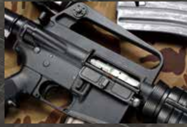
作動性はもちろん、質感、デザインなど、'80年代のモデルガンとは思えないほどリアルに再現されている。