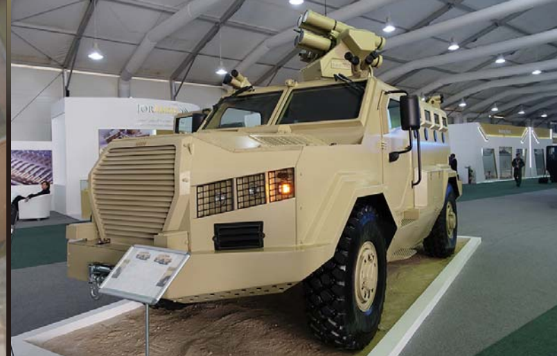
KADDBの大型の4×4装甲車アル・ワッシュ。アル・ワッシュはチェコのタトラのシャーンを流用して開発された。APC（装甲兵員輸送）型は戦闘重量18tで370馬力のディーゼルエンジンと6速のオートマチックの変速機を採用し、最高速度は110km/h、登攀力は60%、航続距離は600kmである。防御力はNATO規格のレベルI～IIである。乗員は最大10名。写真は対戦車型で、アセルサンの対戦車ミサイルターレット、ATMLSが搭載している。