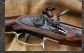
1.ケンタッキー・ライフル系のメイン・メカニズム部分。「タツノオトシゴ」のようなハンマーが特徴だ。2.アメリカ政府が製作した最初のハンドガンと言われるハーバースフェリーは、強化耐久型のハンマーを採用していた。

ケンタッキー・ライフルを小型化した携帯用のハンドガン、ケンタッキー・フリントロック・ピストル。