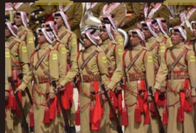
砂漠のパトロールなどを担当するペドウィン部隊が開会式に参加するのは恒例。

また同国では国営兵器工廠KADB（King Abdullah II Design and Development Bureau：アブドゥッ