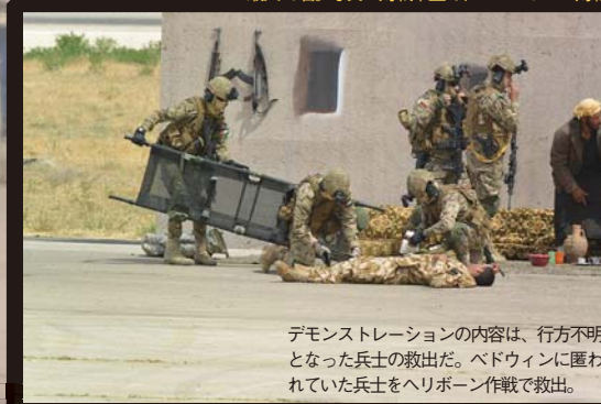
デモンストレーションの内容は、行方不明となった兵士の救出だ。ペドウィンに匿われていた兵士をヘリボーン作戦で救出。