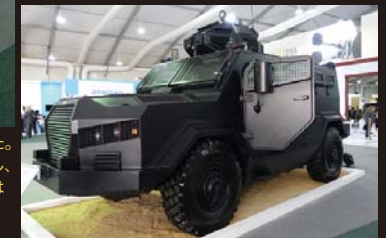
アル・ワッシュ・セキュリティ型。乗員2名+下車歩兵8名で、車体ルーフにはKADDB傘下のJAMCO（Jordan Advanced Machining Company）の12.7mm機銃を搭載した1名用ターレット、スネークヘッド・キューボラMKIIIが搭載されている。さらに状況把握システムも搭載している。