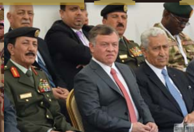
中央の人物がアブドゥラー2世国王。同国のSOCOMの初代司令官でもあった。

ラー2世国王設計開発局）を設立、軍事産業の振興を図っている。KADBは投資顧問会社のような組織であり、実際の兵器や装備などの開発や生産は、子会社である外国企業との合併企業が行なっている。ヨルダンが外国企業の技術移転が期待でき、外国企業側はヨルダンの国内市場はもちろん、周辺諸国への輸出なども